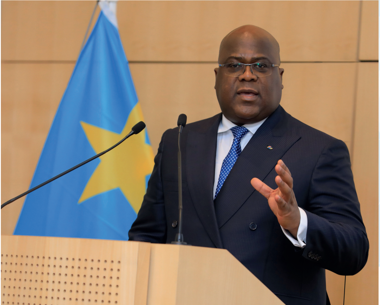
Son Excellence Félix Antoine TSHISEKEDI TSHILOMBO, Président de la République Démocratique du Congo, Chef de l'Etat

«La République Démocratique du Congo qui, par sa position géostratégique, au carrefour des regroupements économiques d'Afrique Centrale, d'Afrique Australe et d'Afrique de l'Est, entend jouer pleinement son rôle de hub de décollage de l'Afrique »